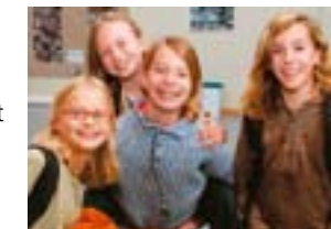
Auch Mädchen fühlen sich bei uns wohl!