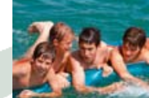
Wir verbinden Schule und Freizeit.